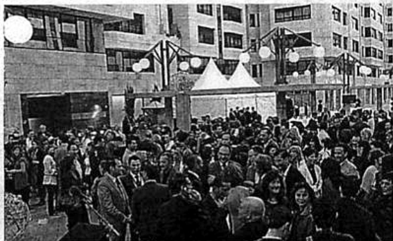
EXPECTACIÓN. Asistentes al acto del nuevo centro de fertilidad.